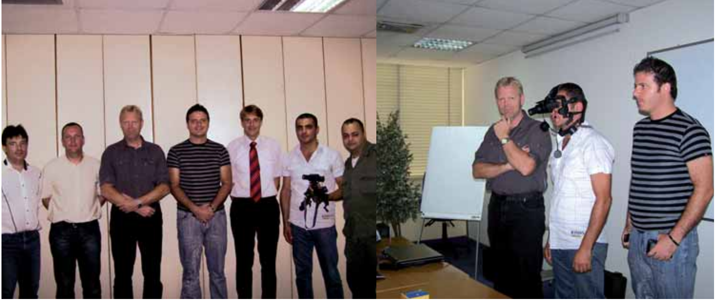
المدرّبون يتوسطون فريقاً من المشاركين