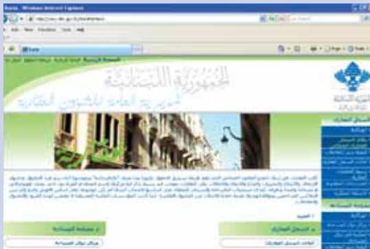
الصفحة الرئيسية للموقع

سنة ٢٠٠٤. ولا يزال العمل جارياً على تطوير وتحديث النظام وتدريب العاملين والموظفين عليه بواسطة الادارة ودائرة المعلوماتية والمعهد المالي - معهد باسل فليحان. لكن مسيرة المكنتنة والتحديث لم تنته عند هذا الحد، إذ أن الموقع الالكتروني نفسه يؤكد أن "الادارة تضع اهدافاً اخرى لتطوير المكنتنة سيجري العمل عليها مستقبلاً.