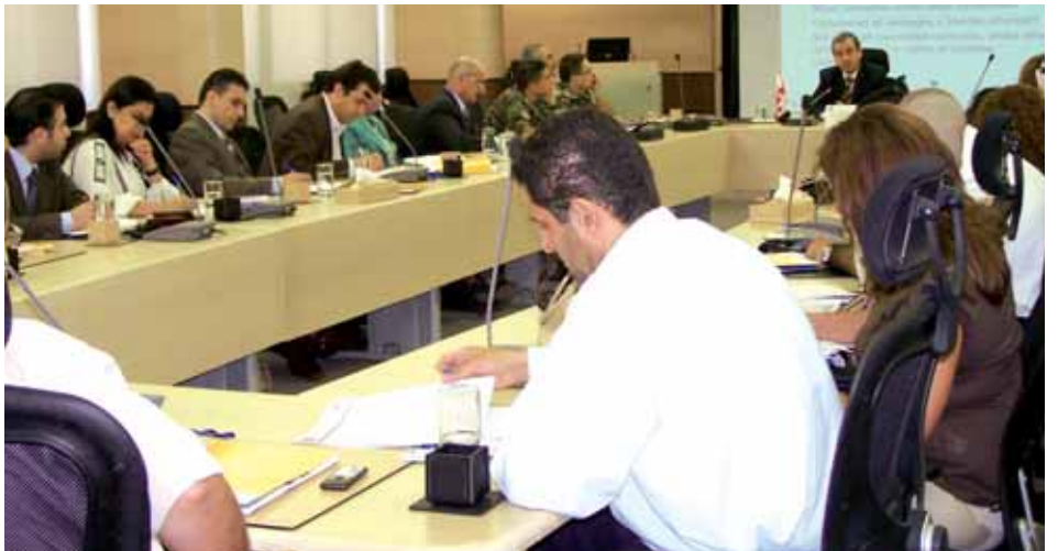
من ورشة العمل عن المناقصات في معهد باسل فليحان