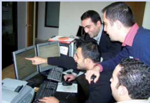
من الدورات الجمركية

شارك في هذه الدورات عدد كبير من المشاركين، وشملت البرامج التدريبية مواضيع مختلفة في الشؤون الجمركية المتخصصة كالبحت عن التهريب، والمعاينة والتفتيش. كذلك استكمل المعهد سلسلة حلقات التدريب حول "تكنولوجيا البضائع والتطبيقات التعريفية" ونظم ضمن هذا الإطار أربع دورات تدريبية عن المواد الغذائية، والمواد الجلدية، والمواد البلاستيكية والمطاطية، بعد دورة تمهيدية للمشاركين تناولت القواعد العامة للتعريفية بحسب النظام المنسق. بالإضافة إلى ذلك، سعى المعهد الى استكمال روزنامة