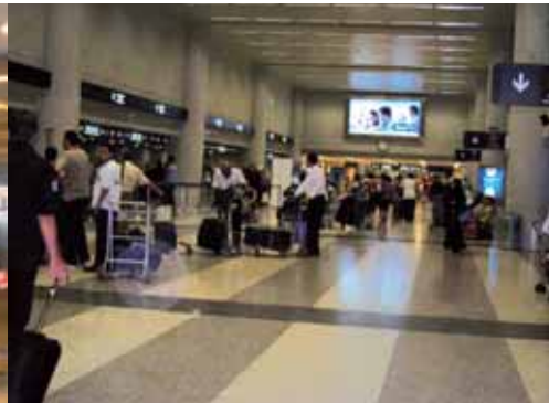
زحمة المطار صيفاً

وأخيراً، خُرق هدوء مطار رفيق الحريري الدولي الذي دام أكثر من سنتين، وعادت الحركة إلى طبيعتها المههودة في صيف كل سنة. لربما كان هذا هدوء ما قبل العاصفة، إذا أن سنة ٢٠٠٨ كانت سنة الأرقام القياسية الجديدة بالنسبة إلى حركة المسافرين والسياح الذين اشتاقوا، على حد تعبيرهم، إلى قضاء فصل الصيف في لبنان بعد أكثر من عامين من الأحداث الأليمة.