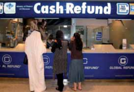
سياح امام مكتب الشركة