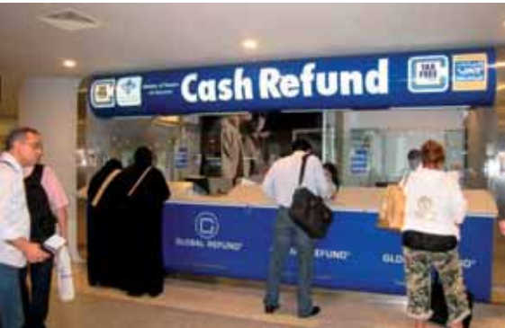
امام شبك الـ Cash Refund

في يوم واحد: ٢٤٠٠ طلب استرداد و ١٢٥ مليون ليرة لبنانية دفعت نقداً تسهيلات في ختم المعاملات لدى مكاتب الجمارك و تفتيش لائق للحقائب ومعاملة لطيفة ابرز الملاحظات: تبسيط نموذج الطلب وتوحيده وزيادة عدد الموظفين في مكاتب الاسترداد