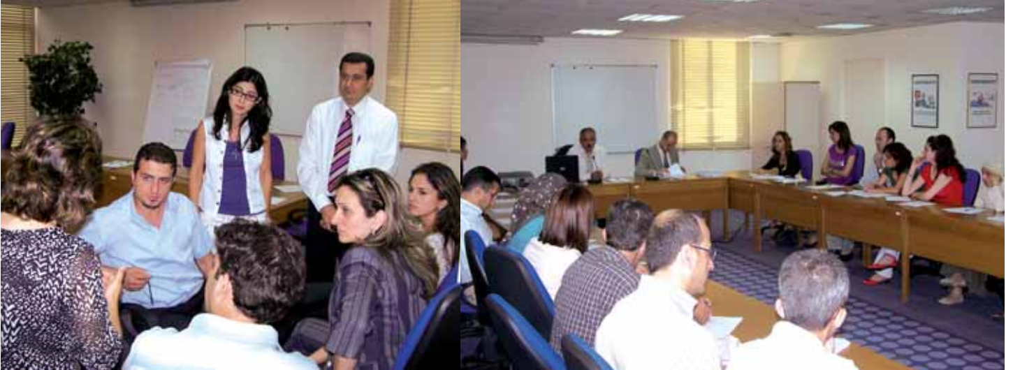
فريق المدربين في الاجتماع التحضيري