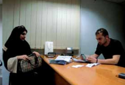
سائحة في مكتب الجمارك